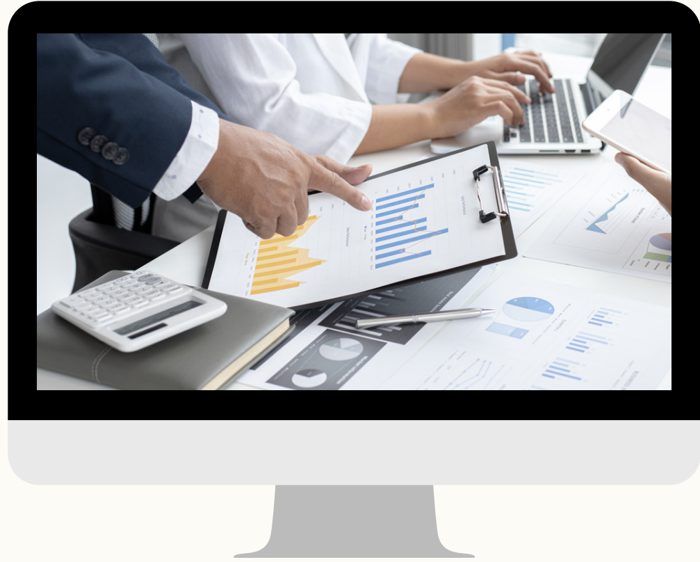
บัญชีค่าตอบแทนขั้นต่ำขั้นสูงของพนักงานในสถาบันอุดมศึกษา ตำแหน่งประเภทวิชาการ