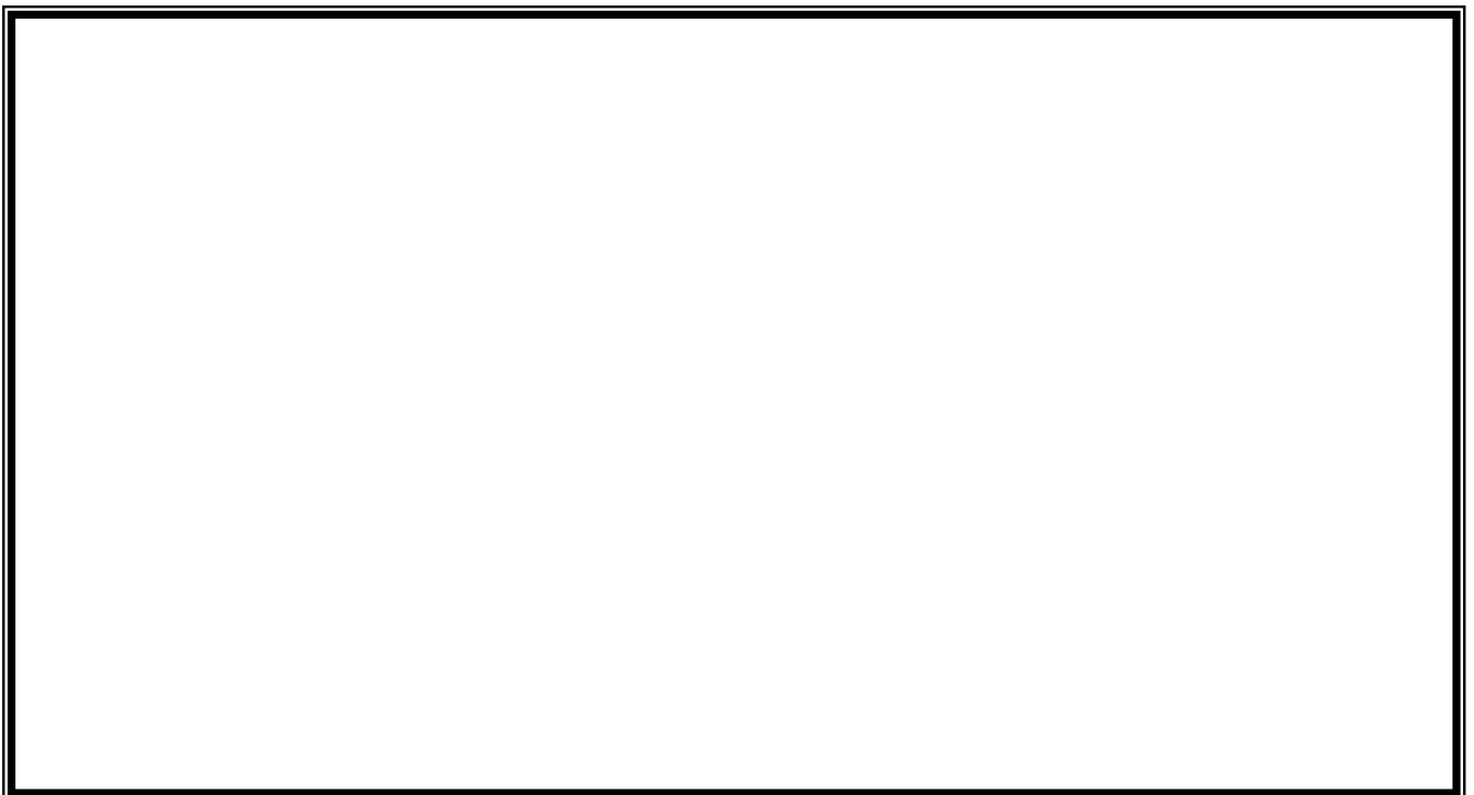
ภาพถ่ายบ้านปัจจุบัน ด้านหน้าข้างบ้าน(ซ้าย)